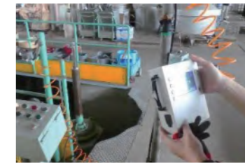
エア漏れ調査状況

染色工場で工場内の機器運用改善及び設備改修についてご相談をいただきました。エアー系統・蒸気系統が工場で使用エネルギーの大部分を占めることから、その部分を中心に省エネ診断を実施しました。提案したコンプレッサーの更新および運用改善によって、年間の電力使用量約226千kWhが削減される見込で、継続支援を行っています。