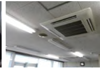
更新後の照明と空調